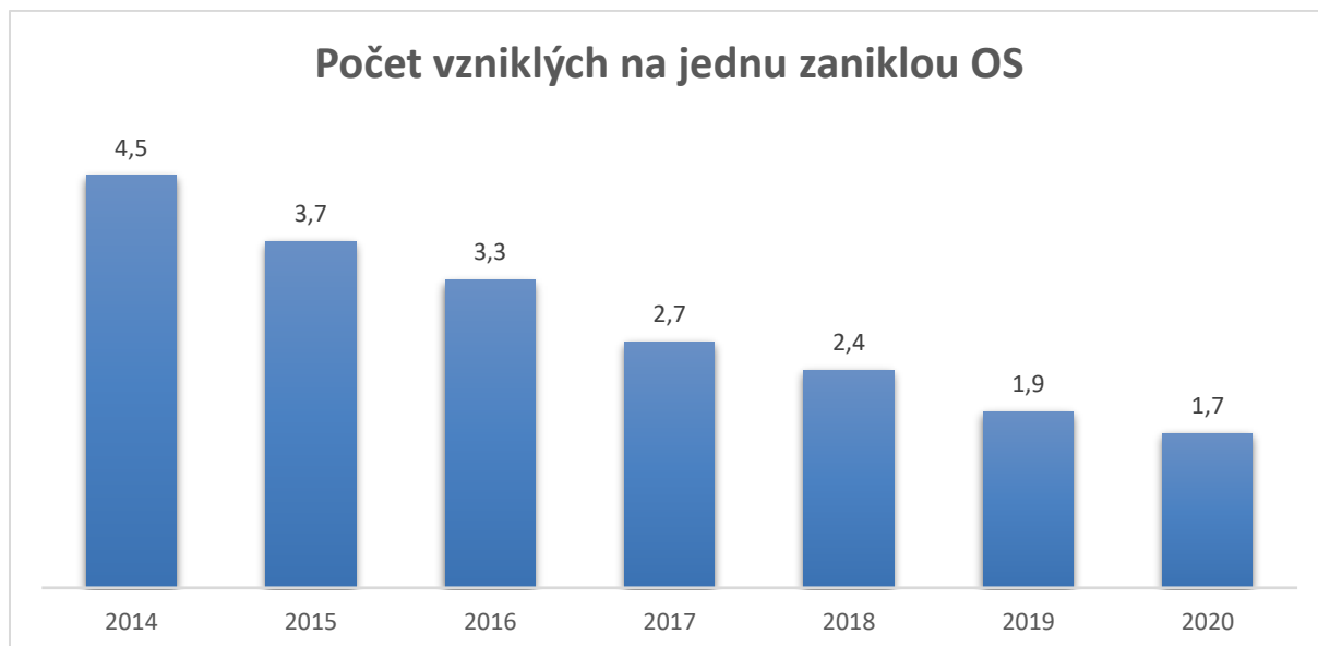
Graf 2: Počet nových společností připadajících na jednu zaniklou v letech 2014-2020