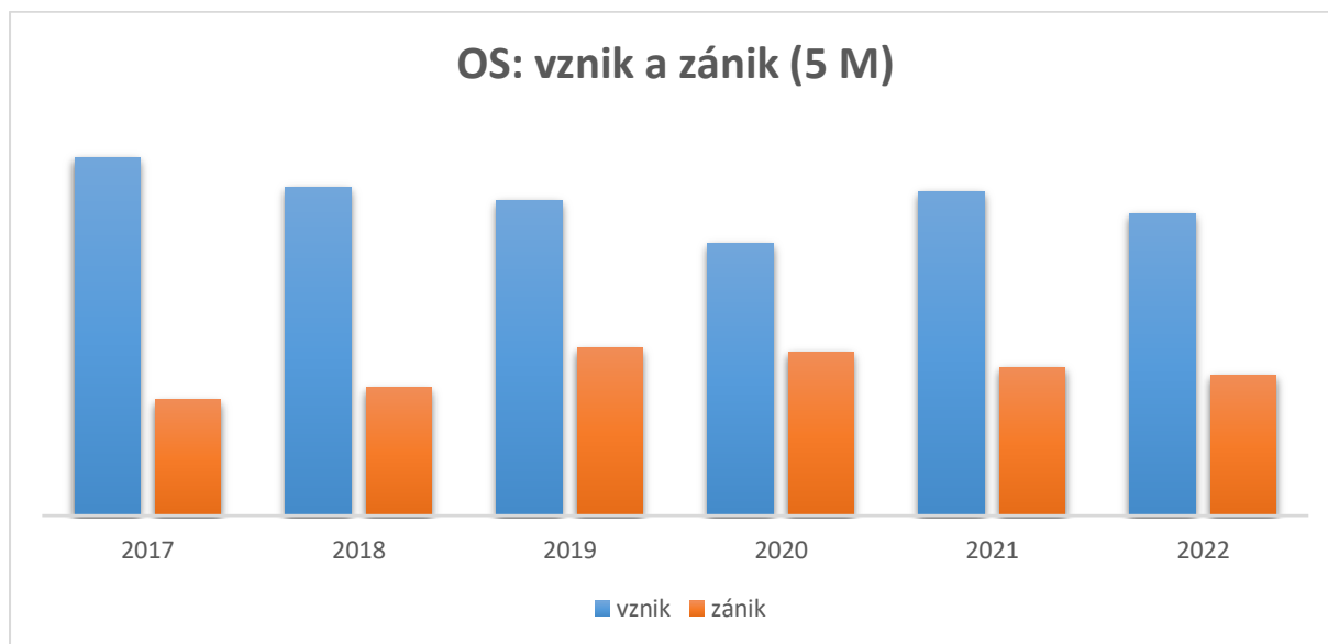
Graf 1: Počet vzniklých a zaniklých OS za prvních 5 měsíců v letech 2017 až 2022