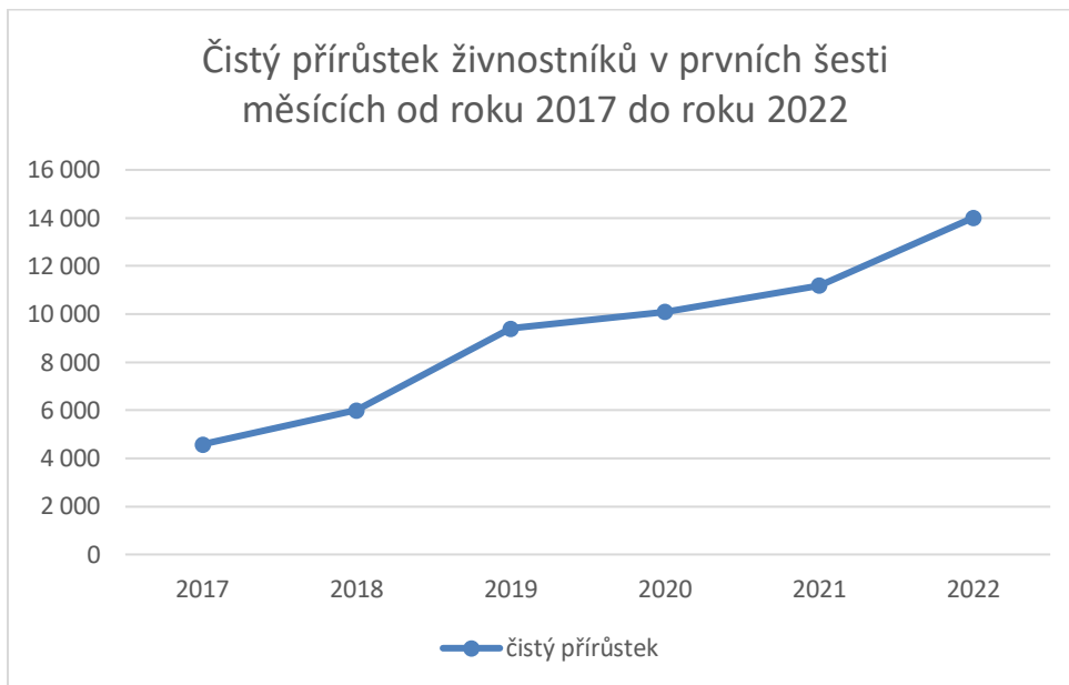
Graf 1: Čistý přírůstek živnostníků v prvních šesti měsících roku mezi lety 2017 až 2022

procenty, což je naopak o procento méně než vloni. Poměr vzniklých a zaniklých živnostníků byl díky tomu u lidí do 30 let 127 ku 10 a u lidí nad 61 let pak 0,4 ku 10.