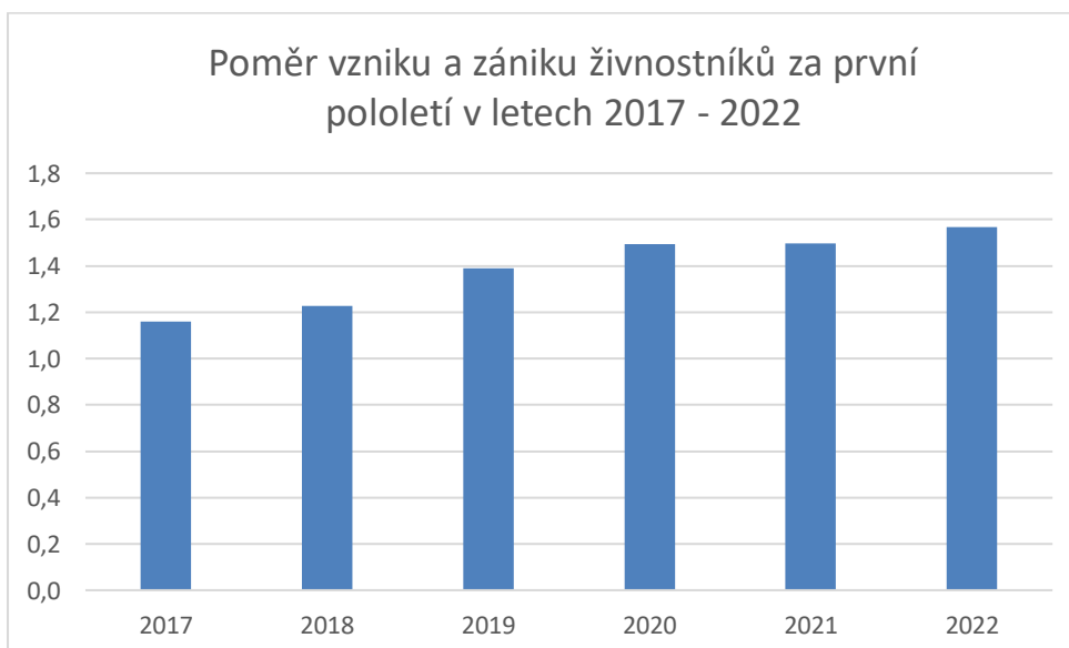
Graf 2: Poměr vzniku a zániku živnostníků za první pololetí v letech 2017 až 2022