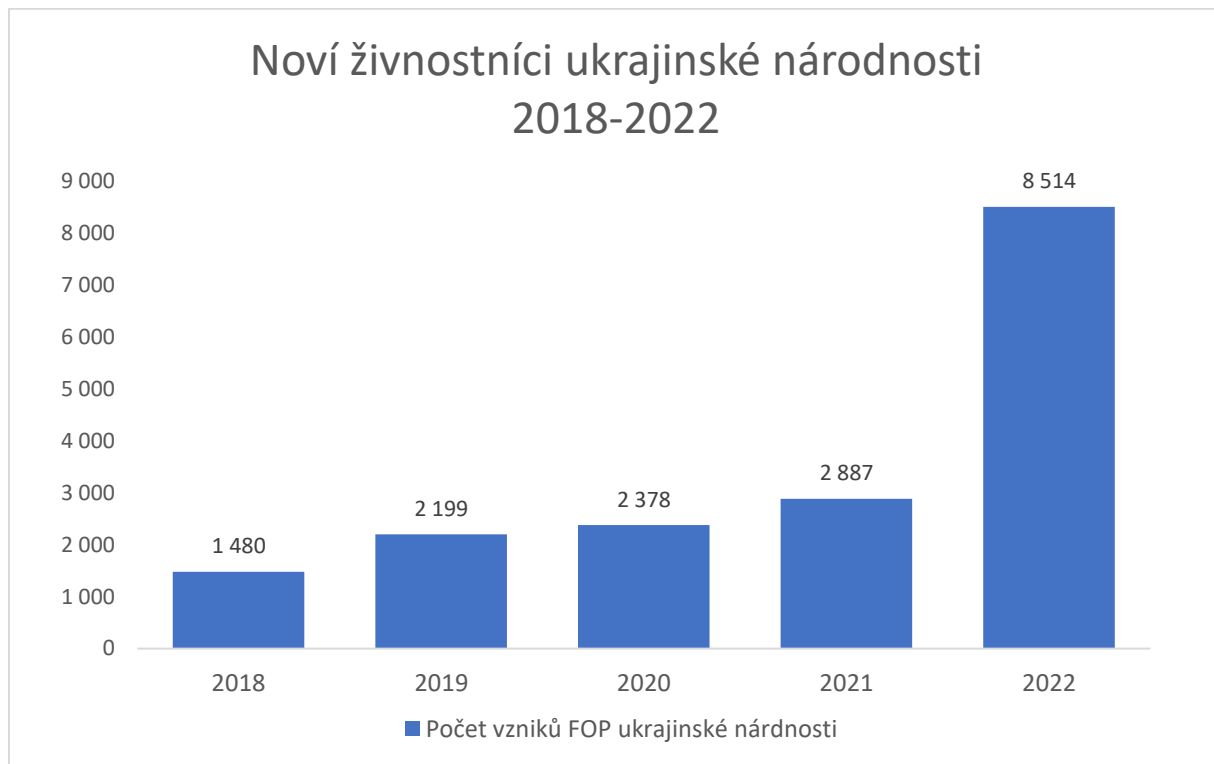
Graf 1: Noví živnostníci UA